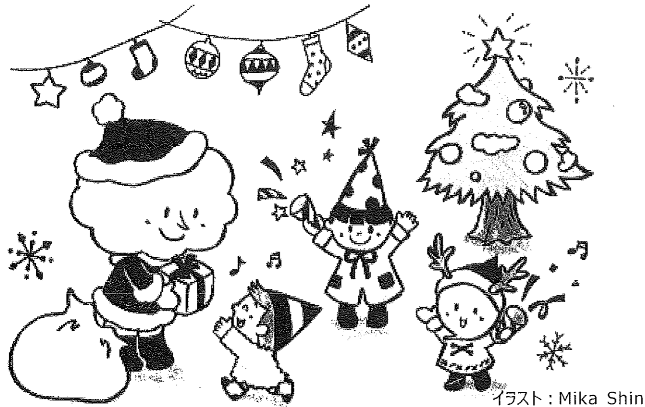
イラスト: Mika Shin

嘉穂郡桂川町大字土居463番地1「桂寿苑」内 ☎0948-65-2271 FAX65-4555 E-mail: fukushi@keisen-shakyo.or.jp